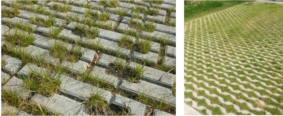
Figuur 5: Referentie bestrating inritten