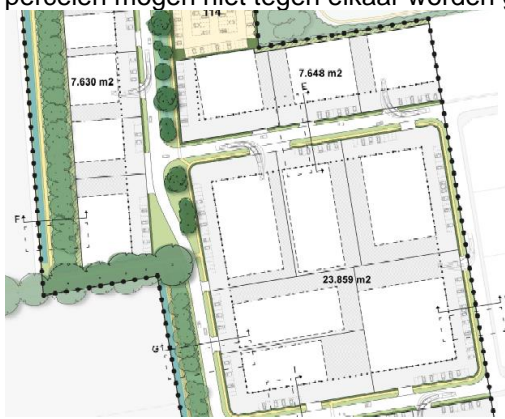
Figuur 1: Illustratie losse bedrijfsgebouwen/afstanden perceelsgrens