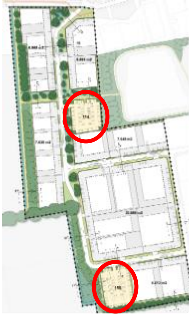
Figuur 3: Locatie openbare parkeervelden

Deze parkeerplaatsen worden in mindering gebracht op het aantal op eigen terrein te realiseren parkeerplaatsen. U kunt deze parkeerplaatsen echter niet 'claimen' en zijn door iedereen te gebruiken.